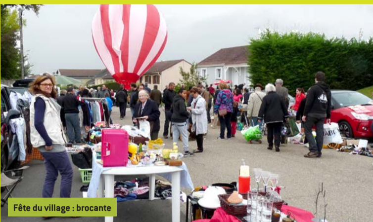
Fête du village : brocante