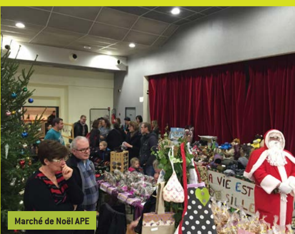
Marché de Noël APE