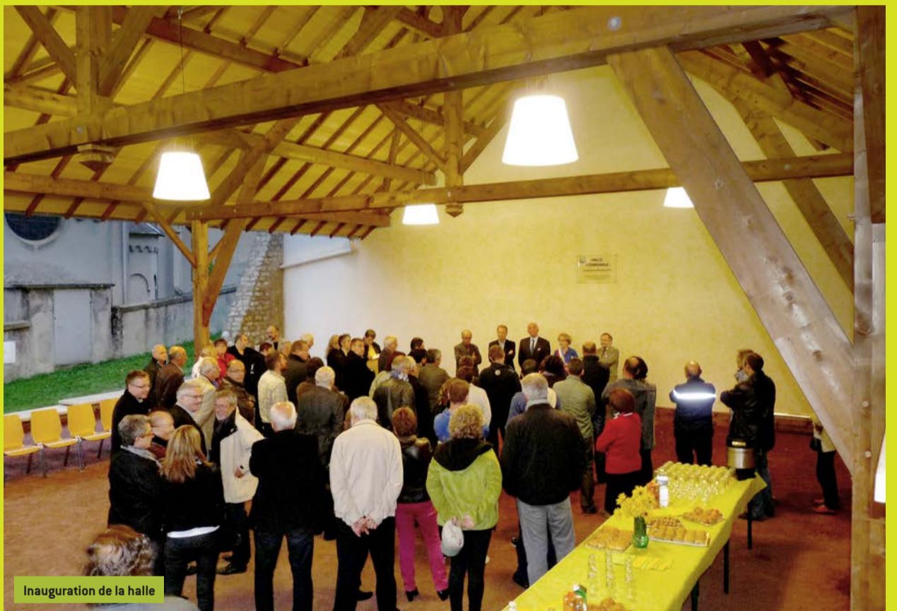
Inauguration de la halle