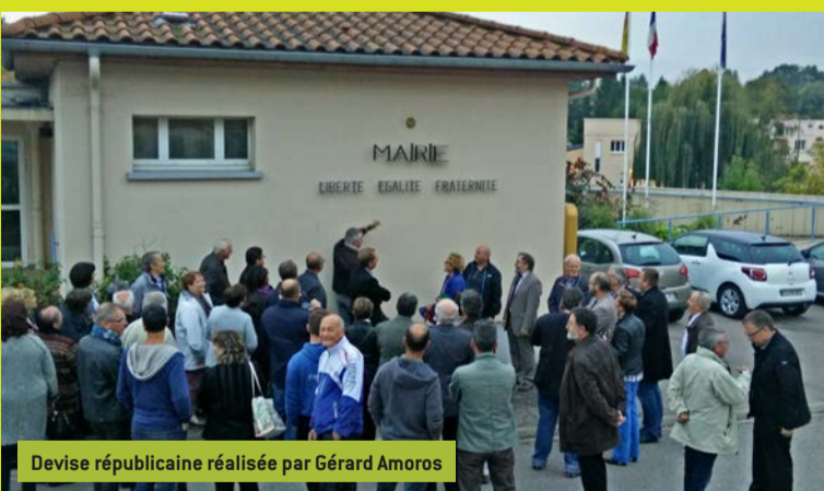
Devise républicaine réalisée par Gérard Amoros