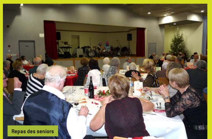
Repas des seniors