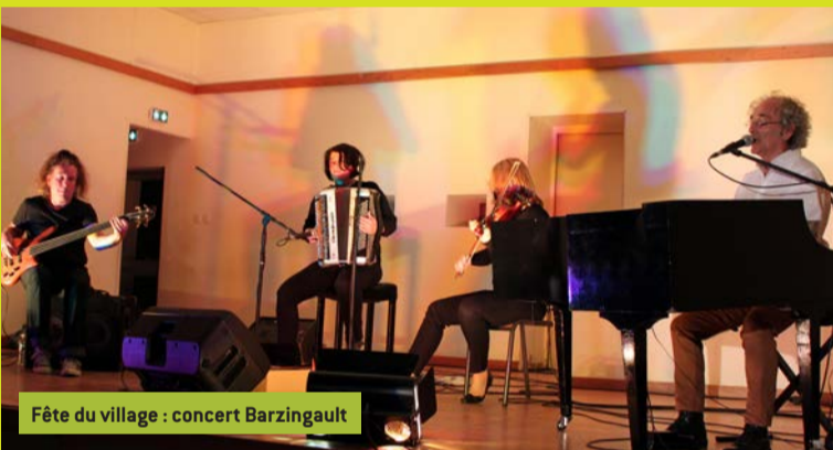
Fête du village : concert Barzingault