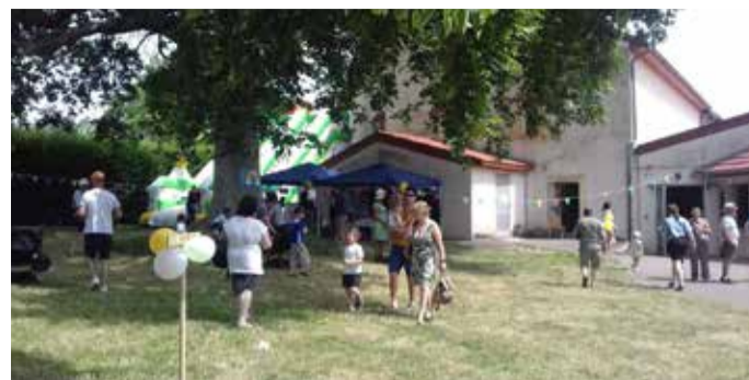
Kermesse organisée par l'école et l'APE