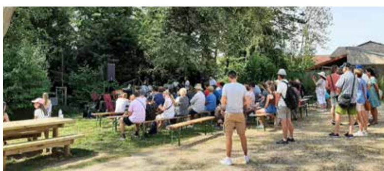
Fête de la musique organisée par Verny Musiques Actuelles