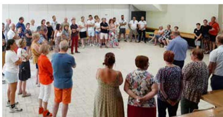
Mise à l'honneur des associations sportives et remerciement aux scrutateurs des élections