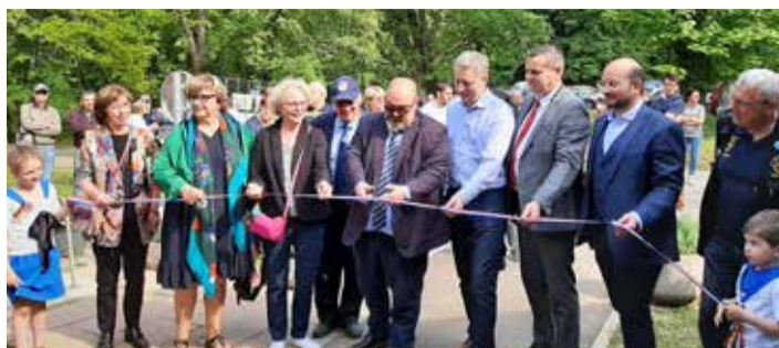
Inauguration du pavillon d'accueil et des mannequins au fort avec l'ADFM

Responsable de la publication : Victorien Nicolas Articles et photos : les conseillers municipaux Mairie de Verny : 6 rue de la Mairie / 57420 Verny Tél : 03 87 52 70 40 Fax : 03 87 52 42 10 mairie@verny.fr http://www.verny.fr