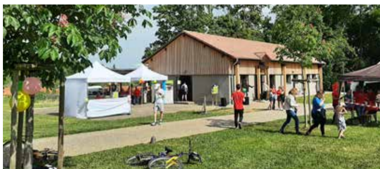
Journée animations jeunesse au parc organisée par l'AFRV