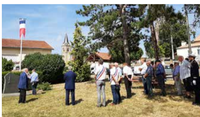
Commémoration du 14 juillet au monument aux morts