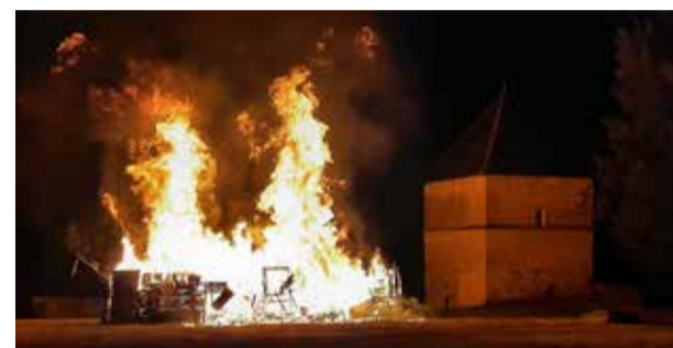
Feu de la Saint-Jean à thème organisé par l'ADPC 57 antenne de Verny