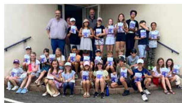
Remise de dictionnaires aux élèves de CM2